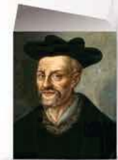
François Rabelais, médecin et écrivain humaniste