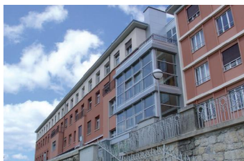
Hôpital du Locle.