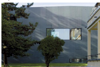
Hôpital de Landeyeux.