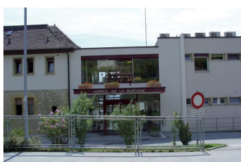
Hôpital de la Béroche.

Ayons des ambitions à la hauteur de nos moyens. Si les moyens financiers ne répondent pas présents, les idées doivent prendre le pas sur le régionalisme.