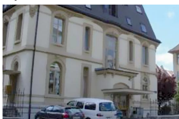
La Chrysalide, à La Chaux-de-Fonds.