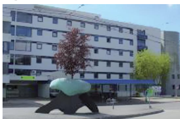
Hôpital de La Chaux-de-Fonds.